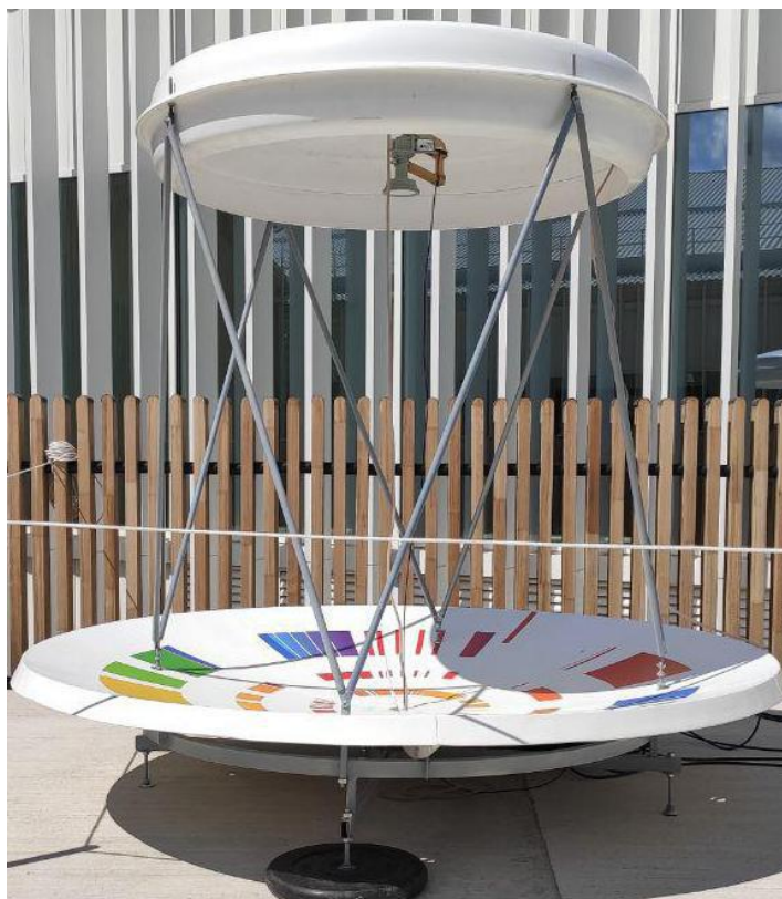
Рис. 1. Внешний вид Комплекса «Лоретт»